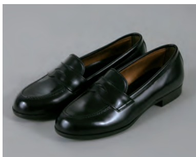
黒革靴(ローファータイプ)