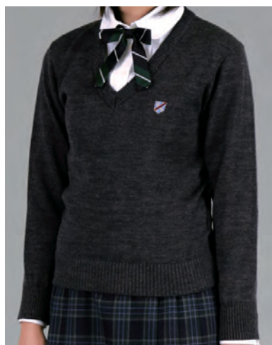
男女共通セーター