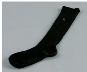
女子黒色ハイソックス