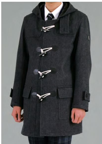
男子ダッフルコート